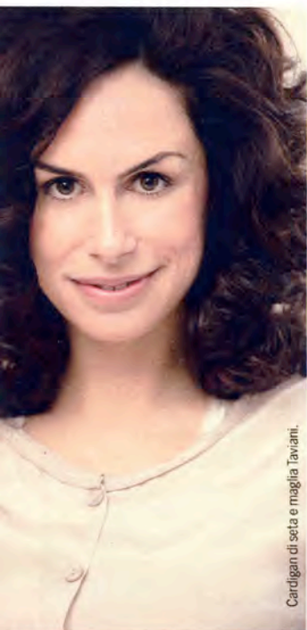
Cardigan di seta e maglia Taviati.